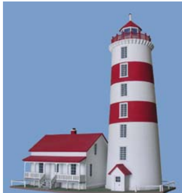
Le phare de Pointe-des-Monts Maquette de Bob Saulnier

Grâce à ces maquettes, la corporation a bien l'intention de traverser le fleuve et d'y poursuivre son travail de sensibilisation.