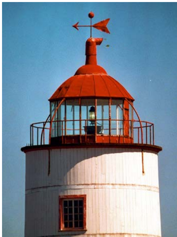
Phare de l'Île Verte