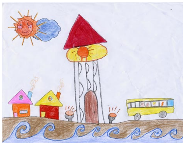
Dessin de Alexandra Dugas

Près de 300 dessins ont été reçus et de ce nombre 100 seront exposés dans le pavillon Empress of Ireland tout l'été. Ces « 100 dessins » feront l'objet d'un vote public. L'auteur du dessin qui recueillera le plus de vote se méritera un bon d'achat d'une valeur de 200$ dans la boutique du Site historique.